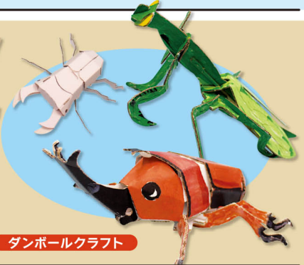
ダンボールクラフト