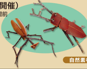
自然素材で工作しよう