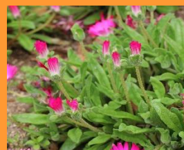
花がとじているとき

また、キクに似た花びらは、全体に光沢があり、陽の光をあびてキラキラ光り、まるで陽だまりの丘に宝石箱をひっくりかえしたような風景をお楽しみいただけます！