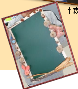
←メッセージボード