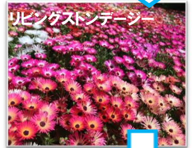
リビングストーンデージー

淡路島国営明石海峡公園の「春のカーニバル」をぜひご紹介くださいますようお願いいたします。