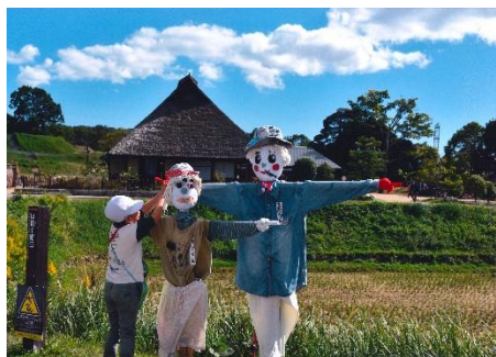
「手袋が外れそうだよ！」