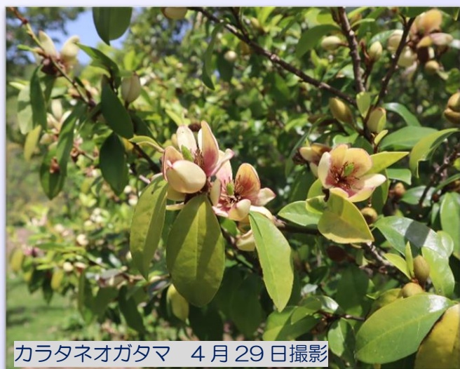
カラタネオガタマ 4月29日撮影

水の棚田周辺では、約600㎡・15,000株の紫色の蘭「シラン（紫蘭）」が見頃を迎えています。 5月上旬頃までご覧いただけます。