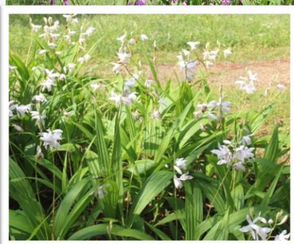
水の棚田周辺にて（2022年4月29日撮影）