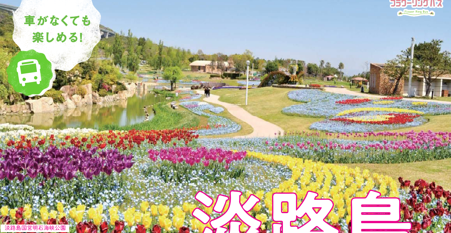
淡路島国営明石海峡公園