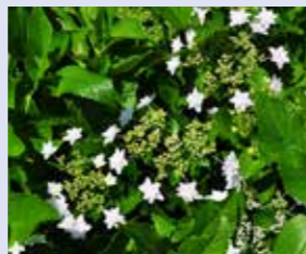
すみだ はなび 隅田の花火 Hydrangea macrophylla 'Sumida-no-hanabi' 額型