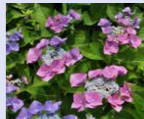
ピンクシャワー Hydrangea 'Pink Shower' 額型