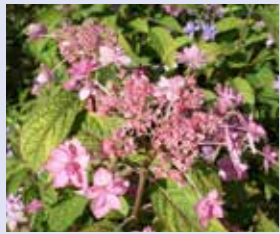
シチダンカ (七段花) Hydrangea serrata 'Shichidanka' 額型