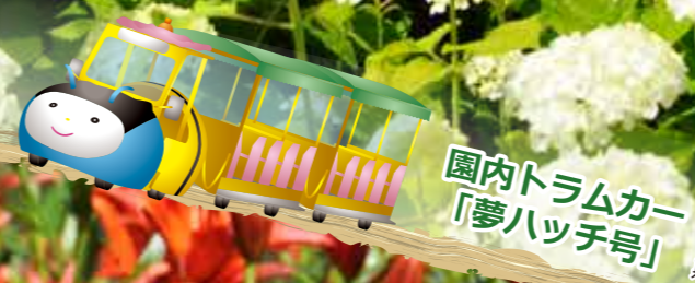
園内トラムカー 「夢ハッチ号」

アジサイが見ごろの期間中は特別ルートを運行します! 期間：6月9日(土)～7月1日(日) 乗車料：300円(1日)