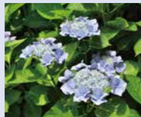
スカイブルー Hydrangea 'Sky Blue' 額型