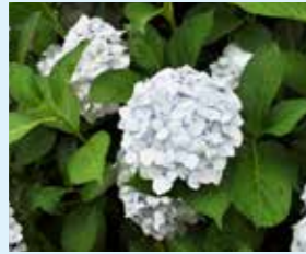
ヒメアジサイ Hydrangea serrata 'Hime-ajisai' 手まり型