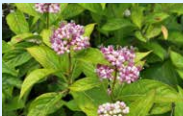
かむい 桂夢衣 Dichroa febrifuga × Hydrangea serrata 'Kamui' 額型 (装飾花なし)