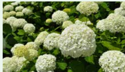
アメリカノリノキ 'アナベル' Hydrangea arborescens 'Annabelle' 手まり型