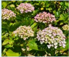
ウズアジサイ Hydrangea macrophylla 'Uzu Ajisai' 手まり型