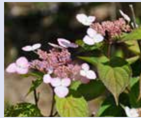
アマチャ (甘茶) Hydrangea serrata 'Amacha' 額型