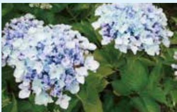
ちちんぷいぷい 桂の地球 Hydrangea 'Titsupui-katsura-no-hoshi' 手まり型 (子持ち咲き)