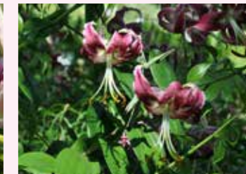
'ブラックビューティー'