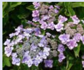
じょうがさき 城ヶ崎 Hydrangea macrophylla 'Jogasaki' 額型