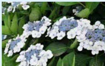
かつら 桂のロクメイカン Hydrangea 'Katsura-no-rokumeikan' 額型