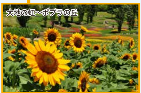
大地の虹～ポプラの丘