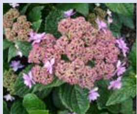
伊豆の華 Hydrangea macrophylla 'Izu-no-hana' 額型