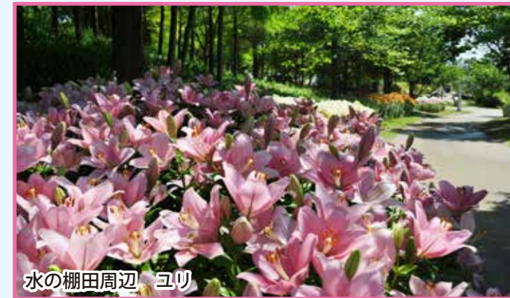
水の棚田周辺 ユリ