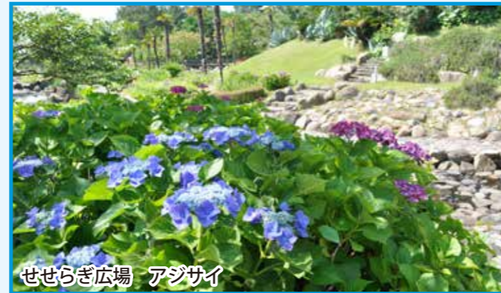
せせらぎ広場 アジサイ