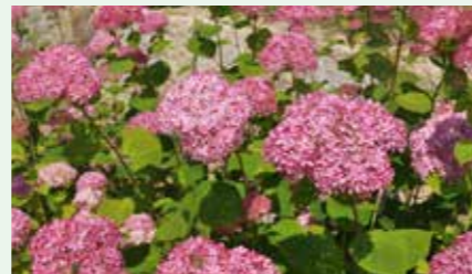
アメリカノリノキ 'ピンクアナベル' Hydrangea arborescens 'NCHA1' 手まり型

北アメリカ東部原産のアジサイの仲間です。白色の直径30cmにもなる大きな花を咲かせる'アナベル'が一番人気のアジサイです。