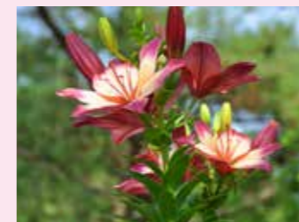
'ハートストリングス'