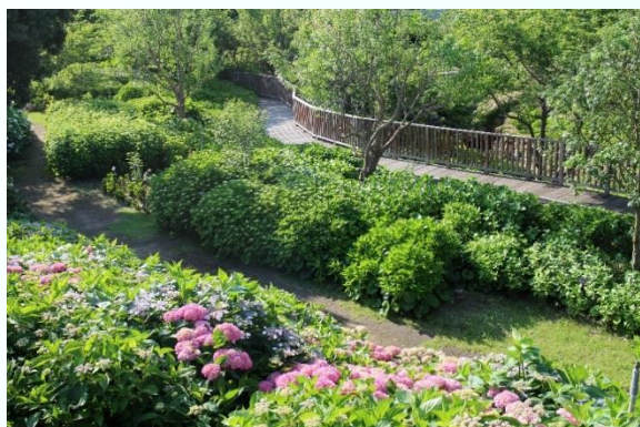
空のテラスの樹林を巡る小径 (2016年6月1日撮影)