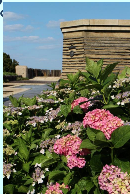
空のテラスにて (2016年6月1日撮影)