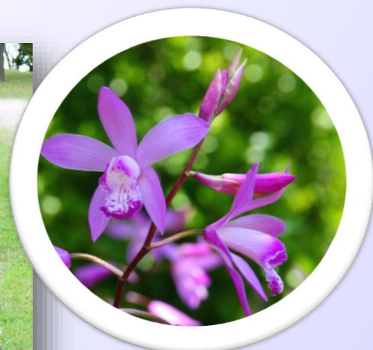
←水の棚田周辺にて (2016年4月24日撮影)

国営明石海峡公園では今、約600㎡・15,000株の紫色の蘭“シラン（紫蘭）”が、例年より10日ほど早く見ごろを迎えており、5月上旬までご覧いただけます。日本、台湾、中国原産でラン科の多年草です。公園では、より多くのシランをお楽しみいただこうと、平成17・18年に、公園ボランティアと協働で、園内に植えられていた株を分け、「水の棚田（里山をイメージしてつくられたエリア）」等へ植栽しました。明石海峡公園で見ごろを迎えているシランをぜひご紹介くださいますようお願いいたします。