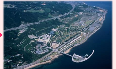
2004年頃 今の公園裸地に緑が戻り開園した公園