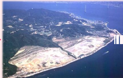
1993年頃 今公園がある場所緑化（木を植えて緑を増やす）前