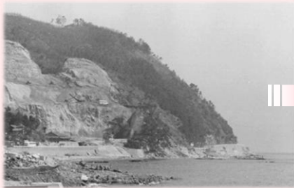
1966年頃 今公園がある場所（灘山）埋め立て用の土取りが始まったころ

●紙しばいで50年前の公園の姿を学びます。⇒●その後、木を植えた場所を見学します。