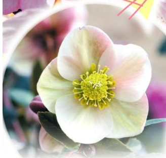
クリスマスローズ (2月上旬~4月上旬)