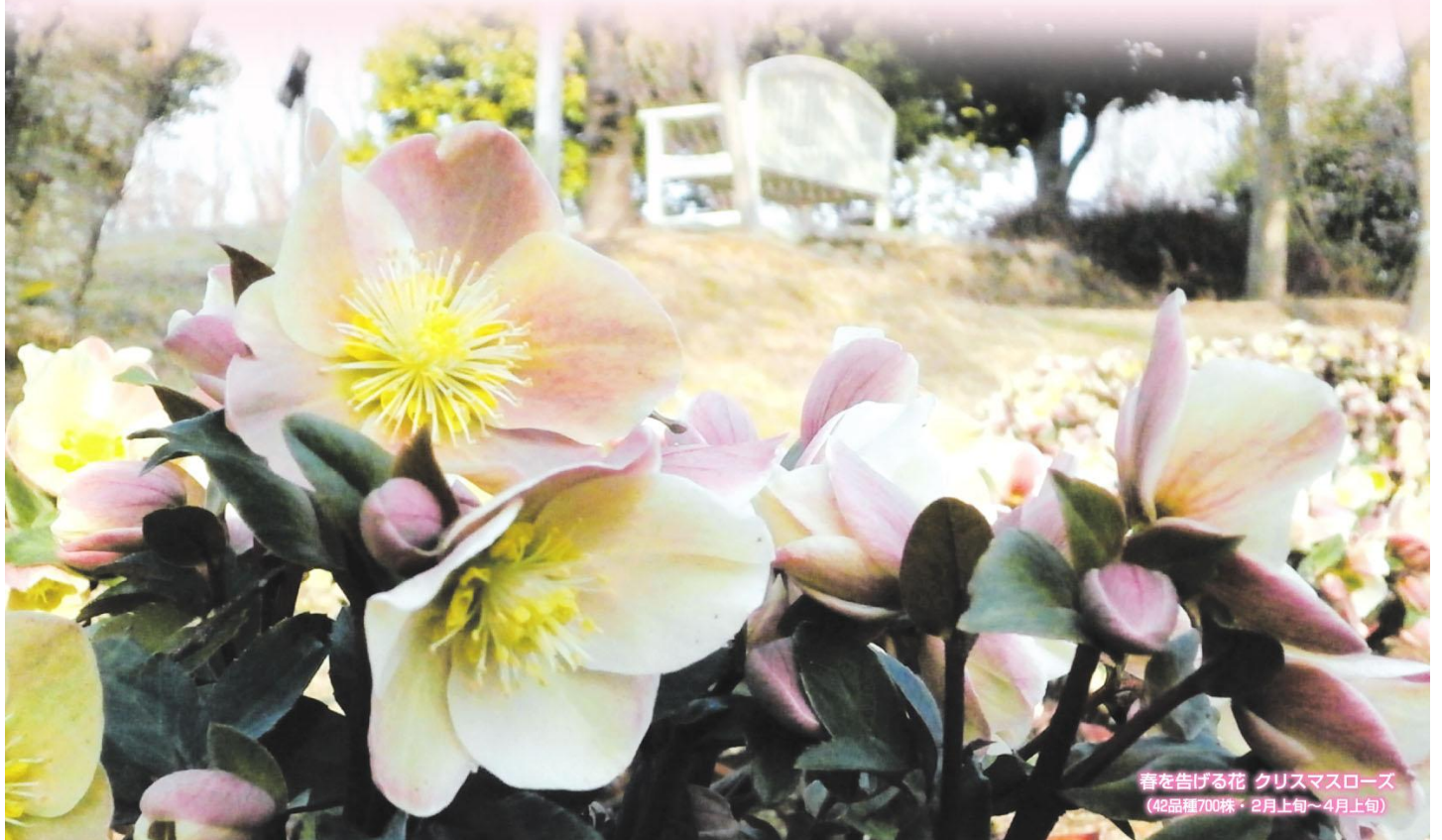
春を告げる花 クリスマスローズ (42品種700株・2月上旬~4月上旬)