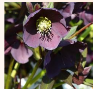
スプリングナイト