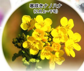
寒咲きナツハナ (2月上~下旬)